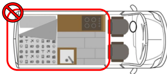
Autocaravana. Parte habitacional y puesto de conducción

domiciliaria consagrado en el artículo 18.2 de la Constitución Española ( STS 621/2012, STS 1165/2006, STS 503/2001, entre otras )