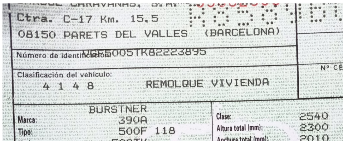
Código de clasificación del vehículo (Ficha técnica)

Si en el apartado destinado a la clasificación del vehículo encontramos las numeraciones 4048, 4148, 4248 y 4348 , se refiere a caravanas o remolques vivienda , clasificados en función de su Masa Máxima Autorizada (MMA). A modo de ejemplo, una caravana de MMA entre 750 y 3500 kilogramos, le corresponde el código 4148 en su ficha de características técnicas (Ver imagen).